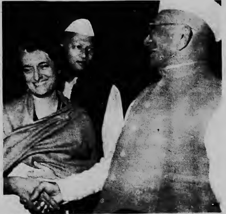
NEW DELHI--Señora Indira Gandhi, di 48 aña, ta sonrei cu ex-minister di finanza Morarji Desai, 69, mientras nan ta duna otro man. Señora Gandhi a ser eligi prome ministra di India pa voto unanime. Desai tabata su opositor mas fuerte.

WILLEMSTAD--E conocido agrupacion musical "The Impressions" lo sali dia sabra awor pa Bonaire, caminda nan tin plania di toca durante di dos funcion den Teatro Caribena Kralendijk Dia domingo den dia e agrupacion lo toca na un picnic ballable, mientras cu ta e intencion tambe cu dia sabra anochi, nan lo toca na Rincon. E grupo cu ta hopi gusta aki na Corsow y indudablemente lo cosecha hopi exito na e isla di Flamingo.